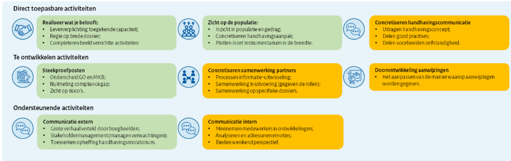
Figuur 1: overzicht activiteiten versterken en verbeteren handhaving naar categorie